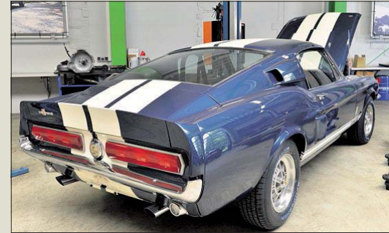
▲ Ein seltenes Exemplar: der Ford Shelby Mustang GT500 aus dem Jahr 1967.