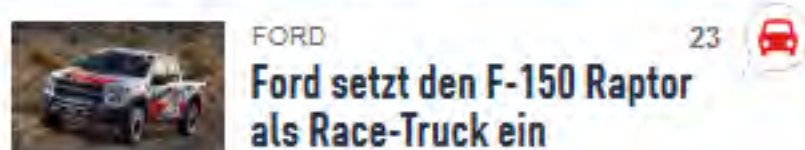
FORD Ford setzt den F-150 Raptor als Race-Truck ein