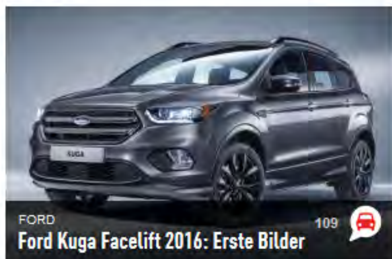
FORD Ford Kuga Facelift 2016: Erste Bilder