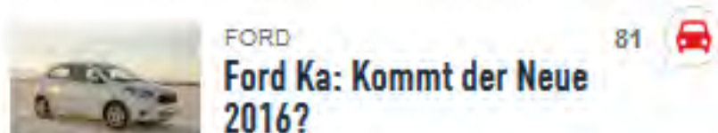
FORD Ford Ka: Kommt der Neue 2016?