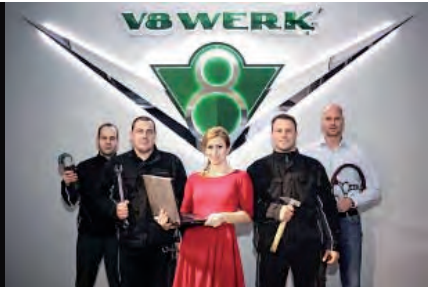
Seit Ende 2011 bietet das V8-Team ein Komplettprogramm rund um US-Fahrzeuge.

Hauptsitz: Müglitztalstraße 10–12 01773 Altenberg OT Bärenstein Zweigstelle Vermietung: Plauenscher Ring 19 01187 Dresden Tel.: +49(0)35054/22 359 v8werk.de