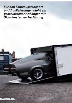
Für den Fahrzeugtransport und Auslieferung steht ein geschlossener Anhänger mit Sichtfenster zur Verfügung.