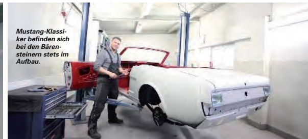
Mustang-Klassiker befinden sich bei den Bärensteinern stets im Aufbau.