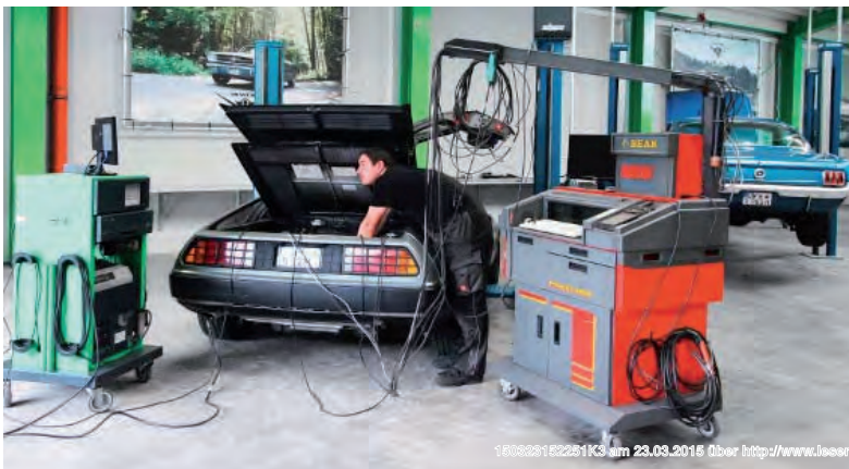
Bestens ausgestattet zeigt sich die Werkstatt des V8 Werks.